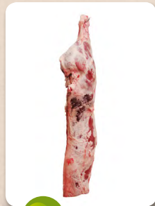
Art. núm. 01302 TRASERO HEMBRA NATURE Art. núm. 01011 TRASERO -U- VACUNO Art. núm. 01012 TRASERO -R- VACUNO Art. núm. 01013 TRASERO -O- VACUNO