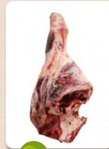
Art. núm. 01306 BOLA HEMBRA NATURE Art. núm. 02600 BOLA -U- VACUNO Art. núm. 02620 BOLA -R- VACUNO Art. núm. 02640 BOLA -O- VACUNO