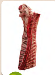
Art. núm. 01304 ENTRECOT HEMBRA NATURE C/H C/S Art. núm. 02100 ENTRECOT VACUNO C/H C/S -18 Art. núm. 02200 ENTRECOT VACUNO C/H C/S 18-22 Art. núm. 02300 ENTRECOT VACUNO C/H C/S +22