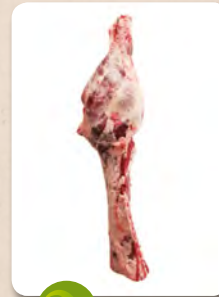
Art. núm. 01307 PISTOLA HEMBRA NATURE Art. núm. 02700 PISTOLA -U- VACUNO Art. núm. 02800 PISTOLA -R- VACUNO Art. núm. 02990 PISTOLA -O- VACUNO