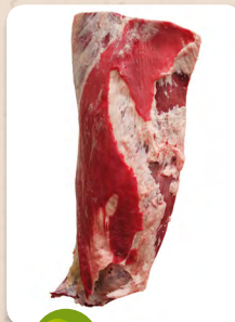
Art. núm. 01305 FALDA HEMBRA NATURE Art. núm. 02400 FALDA VACUNO -20 Art. núm. 02450 FALDA VACUNO +20